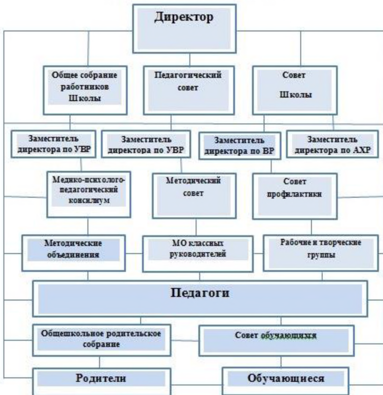
Структура управления МБУ «Школа №34»

Управление образовательным учреждением осуществляется в соответствии с законодательством Российской Федерации с учетом особенностей, установленных Федеральным законом от 29.12.2012 № 273-ФЗ «Об образовании в Российской Федерации» и устанавливается Уставом школы.