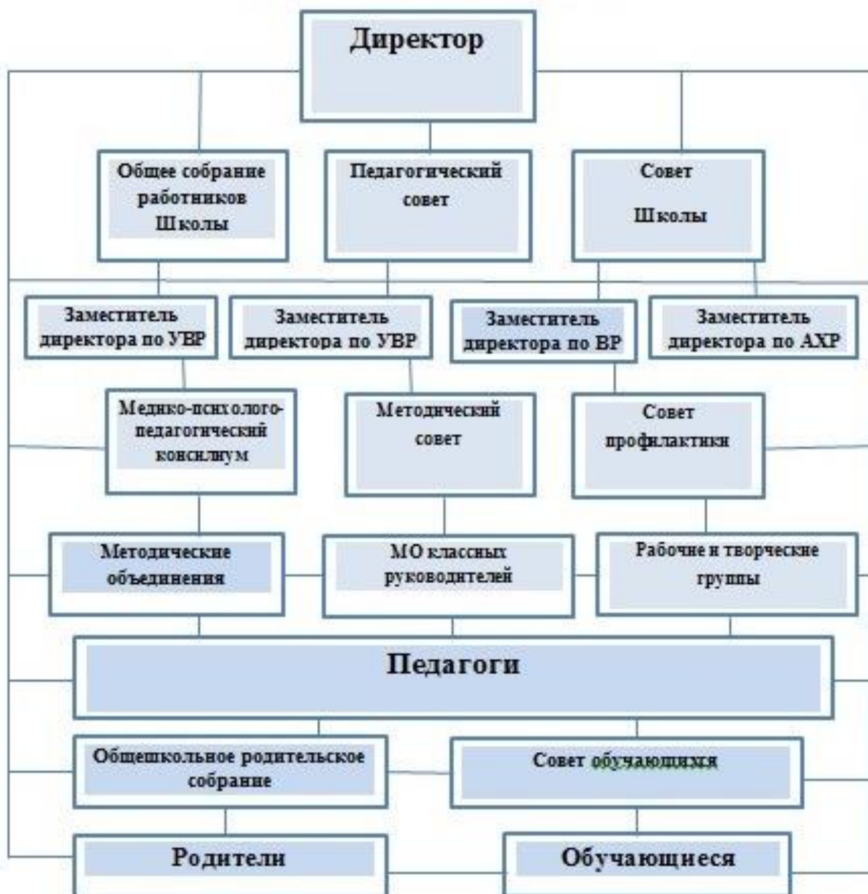
Структура управления МБУ «Школа №34»

Управление образовательным учреждением осуществляется в соответствии с законодательством Российской Федерации с учетом особенностей, установленных Федеральным законом от 29.12.2012 № 273-ФЗ «Об образовании в Российской Федерации» и устанавливается Уставом школы.